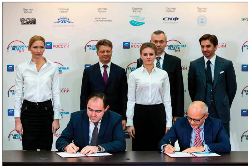
Подписание соглашения между Министерством транспорта Новосибирской области и Группой ВИС

Проект такого масштаба способен привлечь не только прямые инвестиции в регион, но и способствовать социально-экономическому развитию области в целом. По мнению регионального министерства экономического развития, реализация проекта будет стимулировать формирование бизнес-инфраструктуры на прилегающих к мосту территориях и поможет привлечь дополнительные инвестиции.