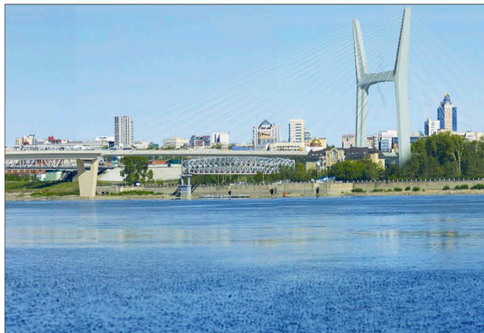
Проект четвертого моста